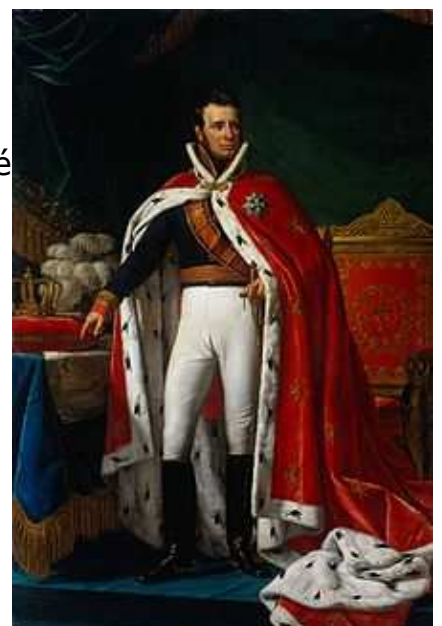
Le roi Guillaume 1er

en 1815, par le traité de Vienne, la Grande-Bretagne a décidé de réunir les Pays-Bas et les provinces du sud qui sont devenus la monarchie des Pays-Bas le roi était Guillaume d'Orange les Belges n'ont pas été consultés pour cette répartition du territoire